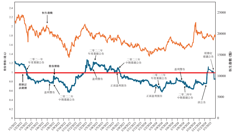
圖1：股份價格表現與經修訂註銷價及恒生指數(「恒生指數」)的比較

下文載列股份於二零二二年一月一日起直至最後實際可行日期(包括該日)止期間(「回顧期間」)在聯交所的收市價變動情況，當中涵蓋 貴公司於回顧期間刊發的近期重大公告。回顧期間被視為足以提供股份近期市場表現的概覽。回顧期間的股份價格表現如下所示：