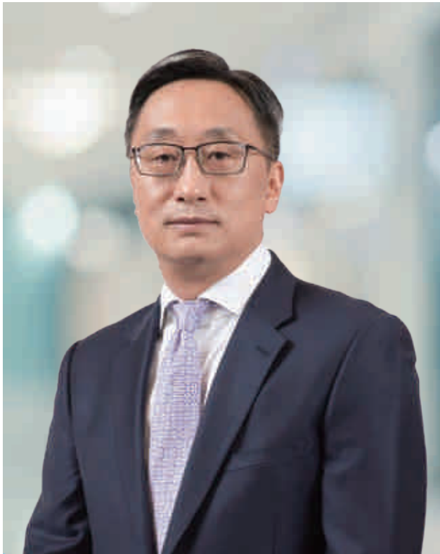
劉 瑀 行長

2023年，面對複雜多變的經營環境，在各界股東、廣大客戶的鼎力支持下，交通銀行全體同仁挺膺擔當、勇毅前行，以金融之力服務中國式現代化，將年初勾畫的「施工圖」高質量轉化為「實景畫」，交出了一份兼具韌性和活力的年度經營答卷。截至2023年末，集團資產總額14.06萬億元，較上年末增長8.23%；全年實現歸屬母公司淨利潤927.28億元，較上年增長0.68%；不良貸款率1.33%，較上年末下降2個基點；撥備覆蓋率195.21%，較上年末提升14.53個百分點。交行穩中向好的經營態勢得到市場的肯定，一級資本排名位列2023年《銀行家》雜誌全球千強榜單第九，並首次入圍全球系統重要性銀行榜單，在全球銀行業的顯示度持續增強，在上海國際金融中心的首位度不斷凸顯。