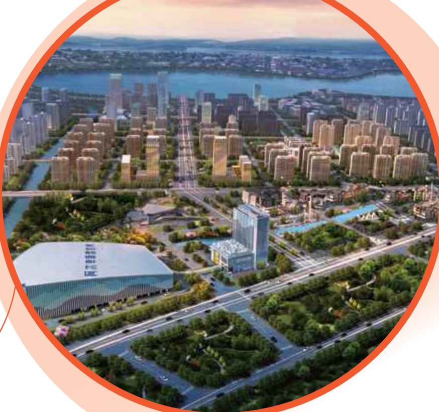
● 太倉阿爾卑斯 國際度假區 • 中國