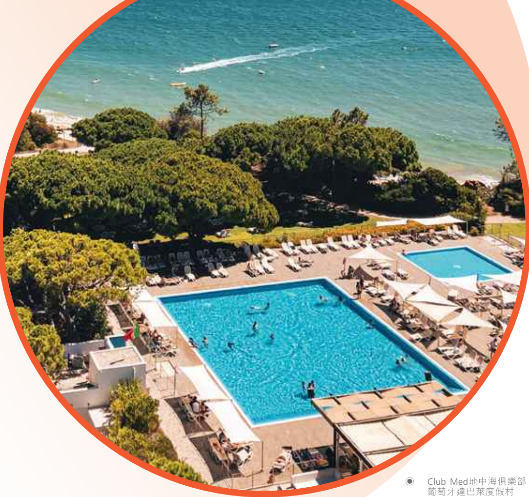
● Club Med地中海俱樂部·葡萄牙達巴萊度假村

2023年，主要受益於歐非中東及巴西的客戶推動山地業務大幅增長，Club Med業績創新高。於2022年強勁復甦之後，美洲業務持續良好表現，亞太地區則於旅行限制取消後出現強勁反彈。繼中國於疫情後全面放開，中國國內旅遊在2023年出現反彈。