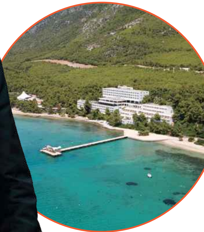
● Club Med地中海俱樂部 • 希臘愛琴海格雷高里曼諾度假村

歷經三年疫情的挑戰，2023年我們終於迎來了全球旅遊業的整體復甦。得益於我們不斷優化的產品組合以及全體員工堅持不懈的努力，复星旅文在2023年實現了扭虧為盈，核心業務更是創出歷史新高。同時，我們的收入結構顯著優化，旅遊運營貢獻的收入佔比超過93%。這一轉變不僅證明了我們聚焦於輕資產運營戰略的有效落實，也為集團的未來的可持續增長奠定了堅實的基礎。