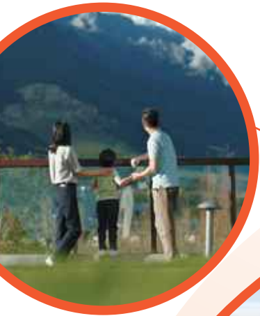
● 麗江地中海國際度假區 • 中國

麗江地中海國際度假區已於2021年9月25日開業。2023年，隨著疫情放開及旅遊行業復甦，麗江地中海國際度假區迎來客流高峰。五一假期期間，麗江地中海國際度假區聯同復星基金會通過「音樂+公益」的模式舉辦簡單假日生活節，實現1,500萬次推廣曝光，累計吸引近萬人參與。6