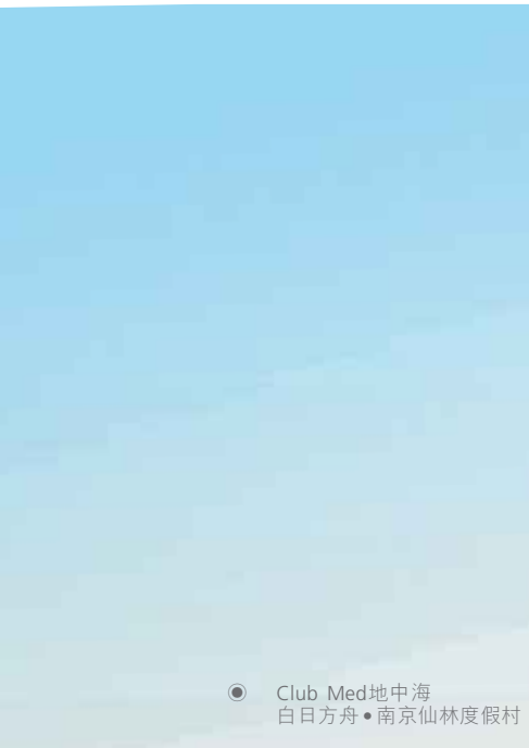
● Club Med地中海 白日方舟•南京仙林度假村