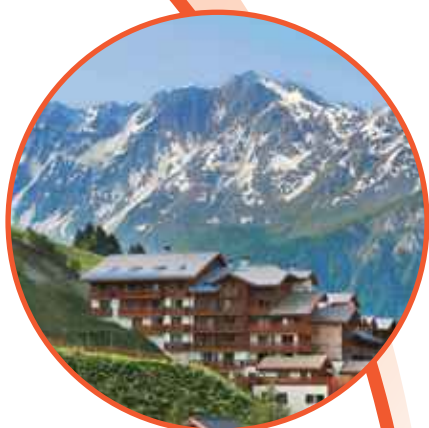
● Club Med地中海俱樂部•法國佩西瓦蘭德里度假村