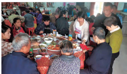
前往降虎村為老年村民發放重陽節慰問金