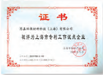
上海市專利工作試點企業