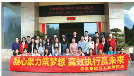
職工素質拓展閱兵活動

本集團於包括呈報期間的過去三年，並無任何因工造成死亡的個案。於呈報期間，本集團共有923天因工傷損失的工作日數，所有工傷已按上述程序妥善處理。