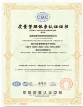
GB/T 19001-2016/ISO 9001:2015 質量管理體系認證證書

為確保產品的質量維持在高水平，以及所提供產品及服務符合安全及健康的規例，我們會對產品定期進行品質的抽查檢驗。同時，福建思嘉已獲得GB/T 19001-2016/ISO 9001:2015質量管理體系認證證書。在呈報期間，「思嘉超能芯地板」產品通過歐盟CE (Conformité Européenne) 認證以及英國UKCA (UK Conformity Assessed) 認證，思嘉新材料產品亦獲得全球回收標準認證證書。