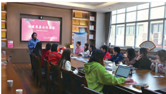
婦女節活動：女性健康主題講座

我們亦十分重視員工的心理及精神健康，為此，我們組織了一系列旨在提升心理健康和促進團隊精神的活動，如健康主題講座、員工親子活動、運動比賽與團建活動等。這些活動不僅讓員工在繁忙的工作之餘有機會放鬆心情，還有助於建立一個互相支持和融洽的工作環境。通過這樣的措施，我們期望能夠提升員工的整體福祉和對公司的歸屬感，並實現工作與生活的和諧平衡。