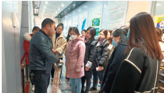
消防設備及消防水帶等器材使用方法培訓

此外，為了進一步保護員工的健康，我們已實施無煙職場政策，禁止任何人士在工作場所內吸煙。我們更設立年度戒煙獎，鼓勵員工遠離煙草。在呈報期間，我們亦提供了健康顧問服務，讓員工可以得到專業的健康諮詢。這些舉措反映了我們對員工健康的承諾和對創建安全工作環境的持續努力。