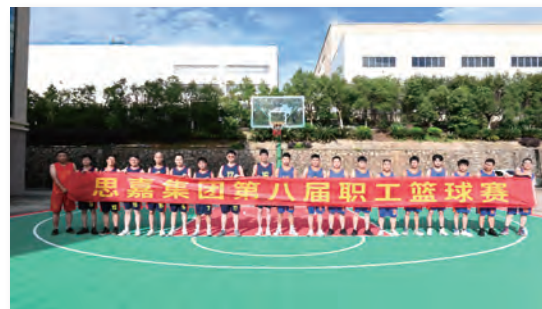
福建思嘉第八屆職工籃球賽