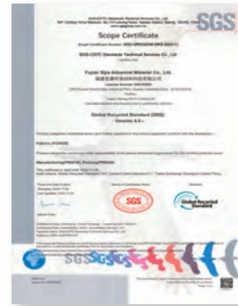
全球回收標準認證證書