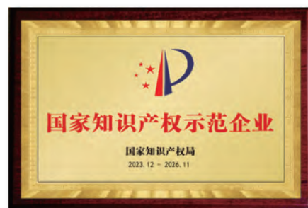
國家知識產權示範企業