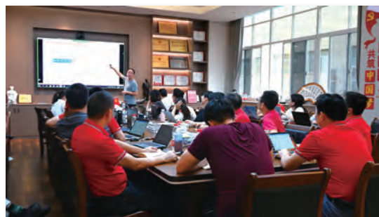
高層骨幹第一屆集訓會議