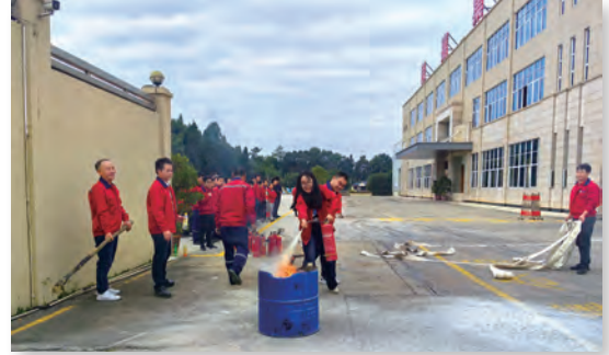
消防實戰培訓與演練活動