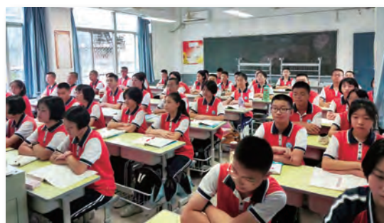
為福州市晉安區八所學校捐贈價值10萬元的課桌椅等物資，用於改善學校的辦學條件。