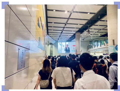
在港鐵站播放宣傳影片