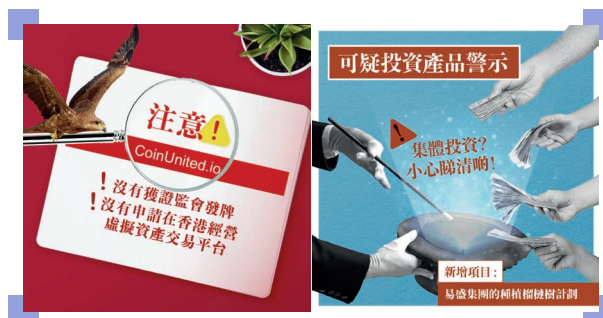
有關可疑實體及投資產品的社交媒體帖文