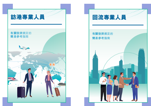
有關發牌規定的新簡易參考指南

我們在9月發表了兩份新的簡易參考指南，以協助訪港及回流的專業人員了解證監會務實的發牌制度。