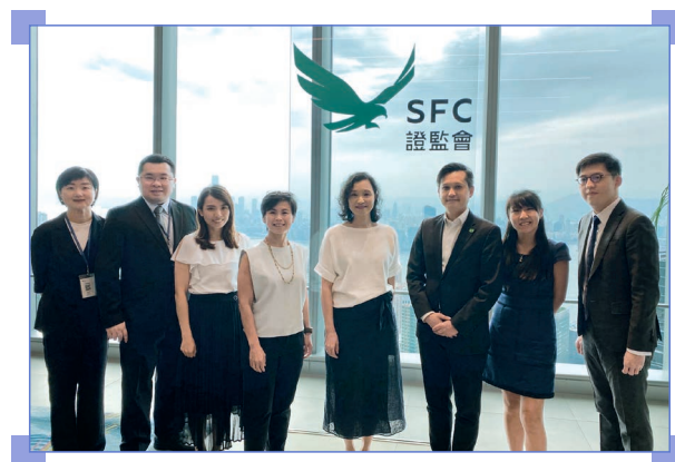
於2024年7月舉行的“建立全面的可持續披露生態圈”研討會

7月，本會為逾百名大學生舉辦了一場名為“建立全面的可持續披露生態圈”的研討會，內容涵蓋本地和全球最新的可持續金融趨勢，披露在促進資本邁向可持續發展和低碳轉型目標的關鍵作用，碳信用在企業脫碳中的用例，以及綠色金融科技在拓展可持續金融方面的潛力。研討會亦展示了由督導小組與香港科技大學研發的溫室氣體排放計算和估算工具。