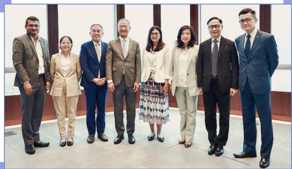
於2024年8月舉行的督導小組會議

本會行政總裁梁女士與金管局總裁余偉文先生於8月共同主持督導小組的會議。各成員在會上就香港採納國際財