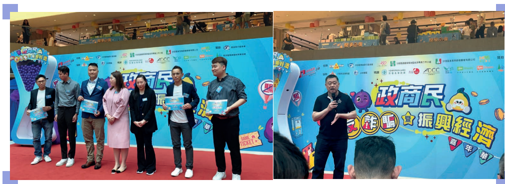
支持反詐騙大聯盟舉辦的社區外展活動並在活動上發言

7月，我們在港鐵香港站的屏幕上播放有關告誡公眾提防投資騙局的影片，並在8月支持反詐騙大聯盟於馬鞍山舉辦的社區活動，分享了避免墮入金融騙局的貼士。