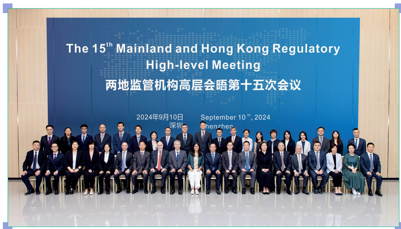
兩地監管機構高層會晤第十五次會議於2024年9月在深圳舉行