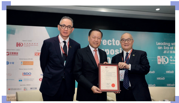
時任主席雷添良先生(中)獲頒香港董事學會榮譽資深會員名銜

雷先生亦在9月於香港董事學會舉行的董事研討會上發表主題演說，並在會上獲頒香港董事學會榮譽資深會員名銜。他分享了董事局應如何引領各項舉措，透過創新來培養企業靈活迅捷地調整業務以應對新挑戰的能力，並強調證監會致力於提升香港的企業管治水平和董事質素。