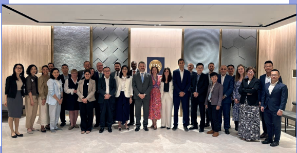
行政總裁梁女士及高層人員於2024年9月出席可持續金融工作小組會議