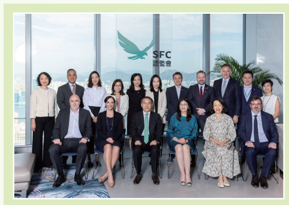
證監會可持續披露論壇

2023年11月，本會舉辦了首屆可持續披露論壇，有超過200位來自金融業、上市公司和業界組織的領袖，及香港、內地及亞太區的政策制定者出席。討論聚焦於在本地推行國際可持續匯報和鑑證準則的益處及挑戰，當中包括作出高質素且具比較性的披露所帶來的巨大集資機會，以及加強公私營協作及利用科技來解決資訊缺口的需要。