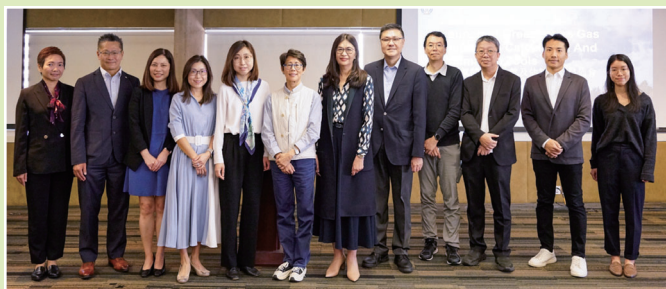
溫室氣體排放計算及估算工具發布會

綠色金融科技有潛力促進可持續發展相關信息的流動，並在多方面支持金融機構，例如協助它們符合監管規定，作出有根據的投資決策和開發新金融產品。該地圖旨在幫助企業和金融機構識別符合業務需求的綠色金融科技方案。