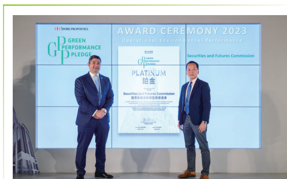
證監會獲得“環境績效約章”白金獎

我們在鰂魚涌的辦公處所將綠色因素納入考慮範圍，並獲得“綠建環評”的白金級認證，即現有最高評級。年內，我們通過進行了一系列減排工作（詳見下文）和聚焦於減廢和回收的企業綠色措施，在節約能源、用水效益和廢棄物分類方面有顯著改善 10 。