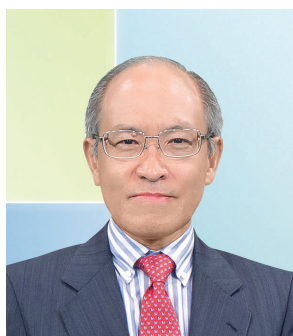
黃奕鑑 SBS, MH, JP